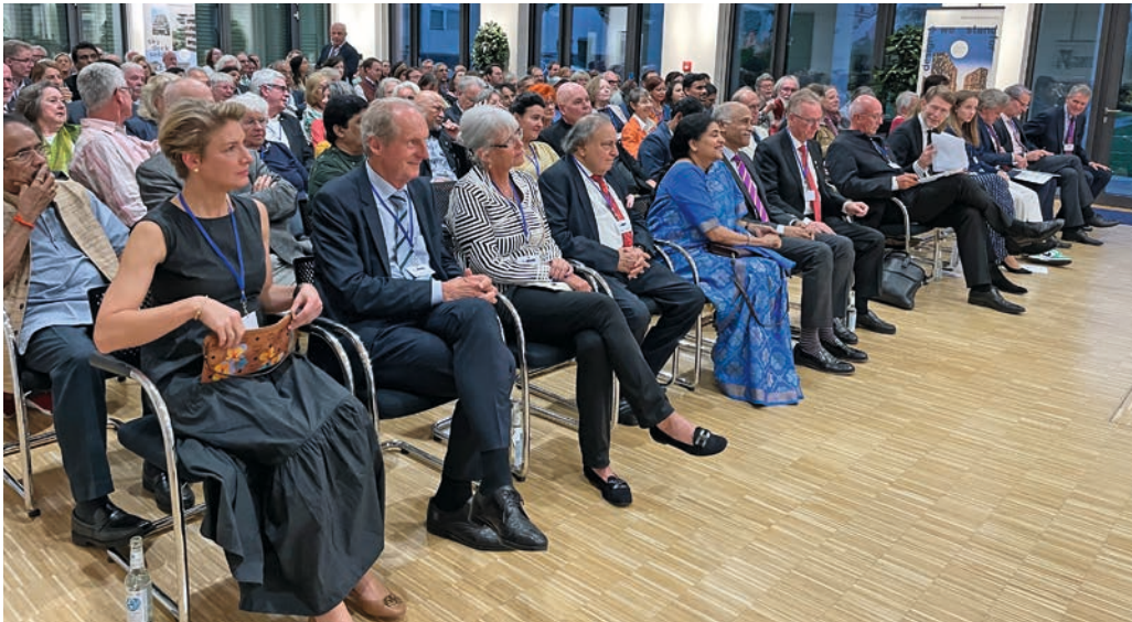
Gäste des Festaktes zum 70-jährigen Jubiläum der DIG