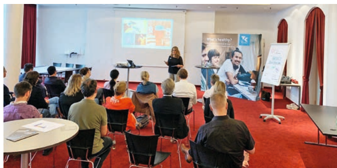
Vorträge zu Fachthemen und Lösungsansätze für aktuelle Herausforderungen