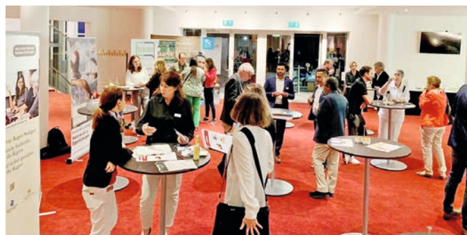
Regel Austausch zwischen den Teilnehmern