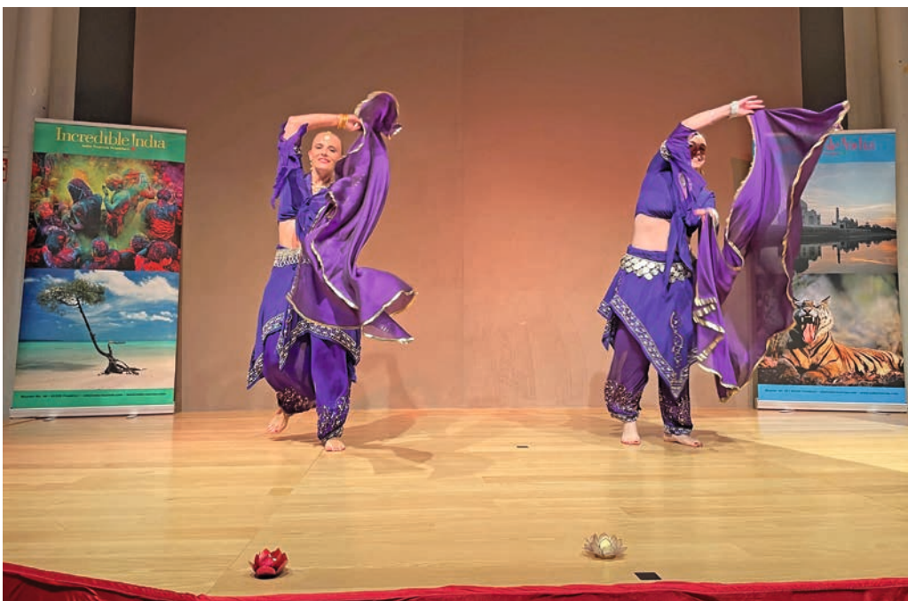
Auftritt der Tänzerinnen