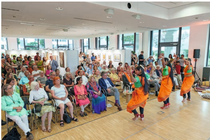
Vernissage zur 19. Kunstausstellung

Der Abend wurde abgerundet durch tänzerische und musikalische Einlagen sowie mit einem kleinen Imbiss.