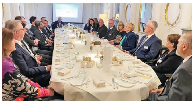
GIRT-Teilnehmer tauschen sich aus