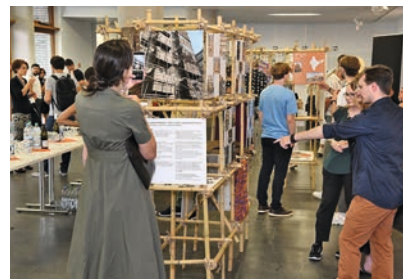
Ausstellung während des Symposiums