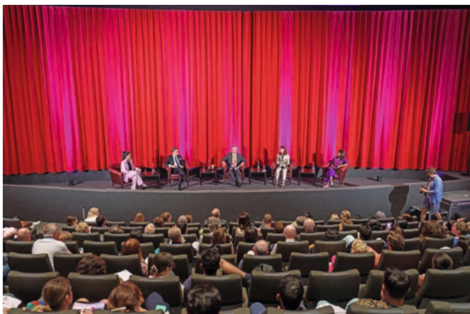
Podiumsdiskussion „Neues HEIMATLÄND Baden-Württemberg – Wirtschaftliches Potential – Willkommenskultur – Lebensqualität“