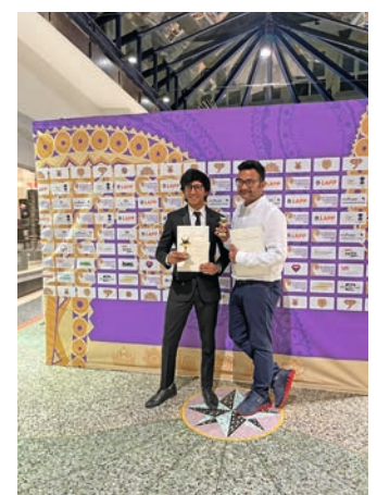
Zwei glückliche Gewinner des German Star of India