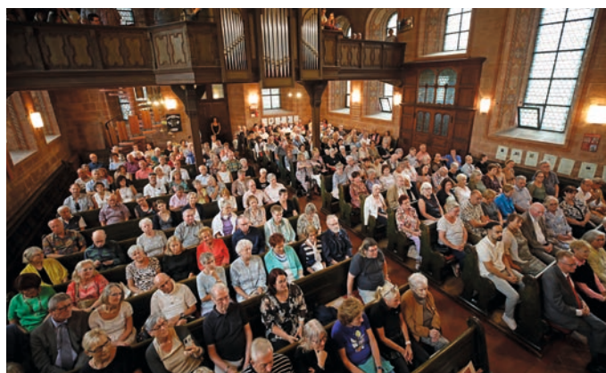
Volle Bänke in der Klosterkirche