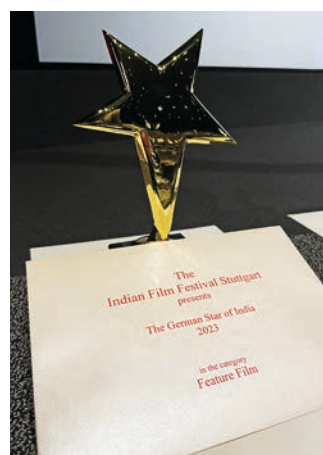
The German Star of India – ein begehrter Preis für indische Filmemacher