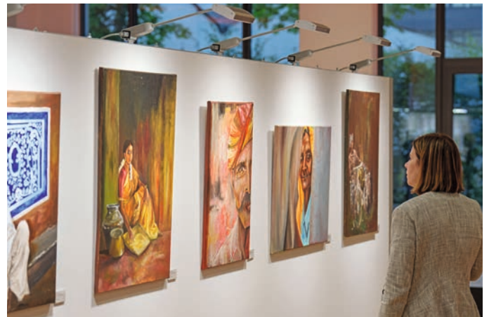
Kunstausstellung „Indische Begegnungen“ 2023