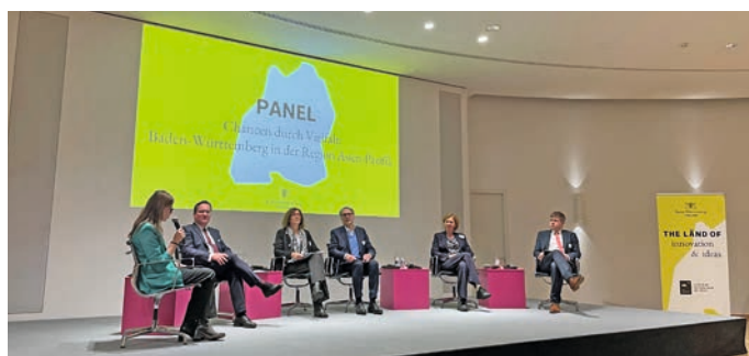
Podiumsdiskussion mit Vertretern aus Wirtschaft, Wissenschaft, Wirtschaftsministerium, Auswärtigem Amt und Chinaforschung zum Thema „Chancen durch Vielfalt: Baden-Württemberg in der Region Asien-Pazifik“