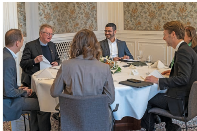
Gemeinsamer Rückblick auf die Indienaktivitäten 2023 und Ausblick in das Jahr 2024